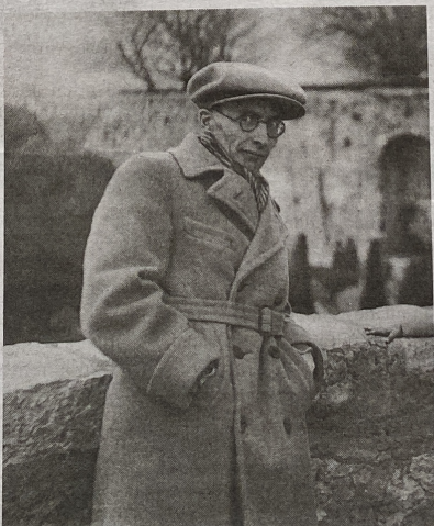
Viimeinen valokuva Uuno Kailaasta on otettu vuoristossa Nizzan lähillä.

KESKUSTELU oli pettymys. Äiti oli luvannut aikanaan pitää asiat omalla tietonaan eikä ollut muutenkaan halukas avautumaan menneisyydestään.